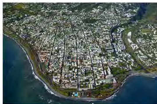
Vue aérienne du centre ville de Saint Denis

La résidence Les Jacquiers se trouve au sein du quartier de Sainte Clotilde, à 300 mètres de l'Université de la Réunion, du rectorat et de l'Hôtel de région .