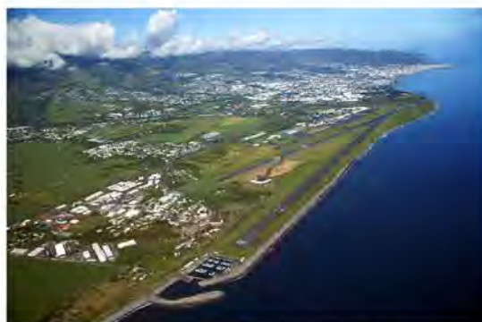
Aéroport international Roland Garros