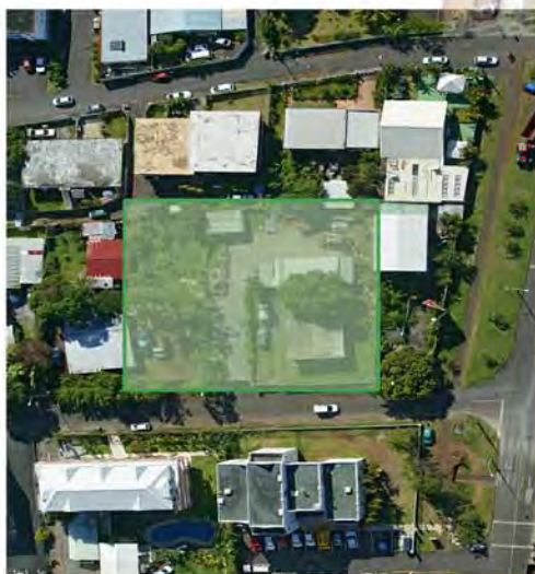
Photo aplomb terrain