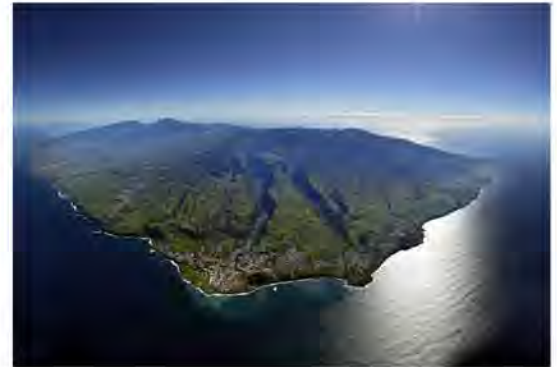
La Réunion vue du ciel

Un emplacement géographique privilégié, des perspectives démographiques fortes, une croissance économique soutenue et un environnement politique stable font aujourd'hui de la Réunion une opportunité rare pour réaliser un investissement immobilier dans les meilleures conditions.