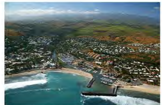
Saint Gilles Les Bains