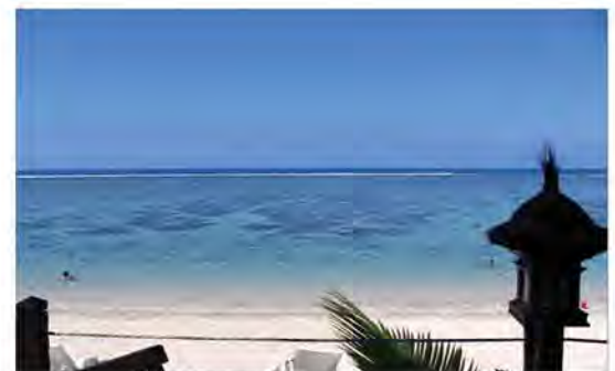
Plage de l'Hermitage