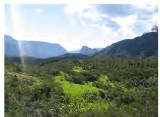
Cirque de Mafate