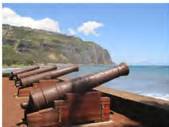
Promenade du barchois