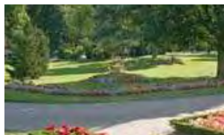
Parc Cadet de Vaux