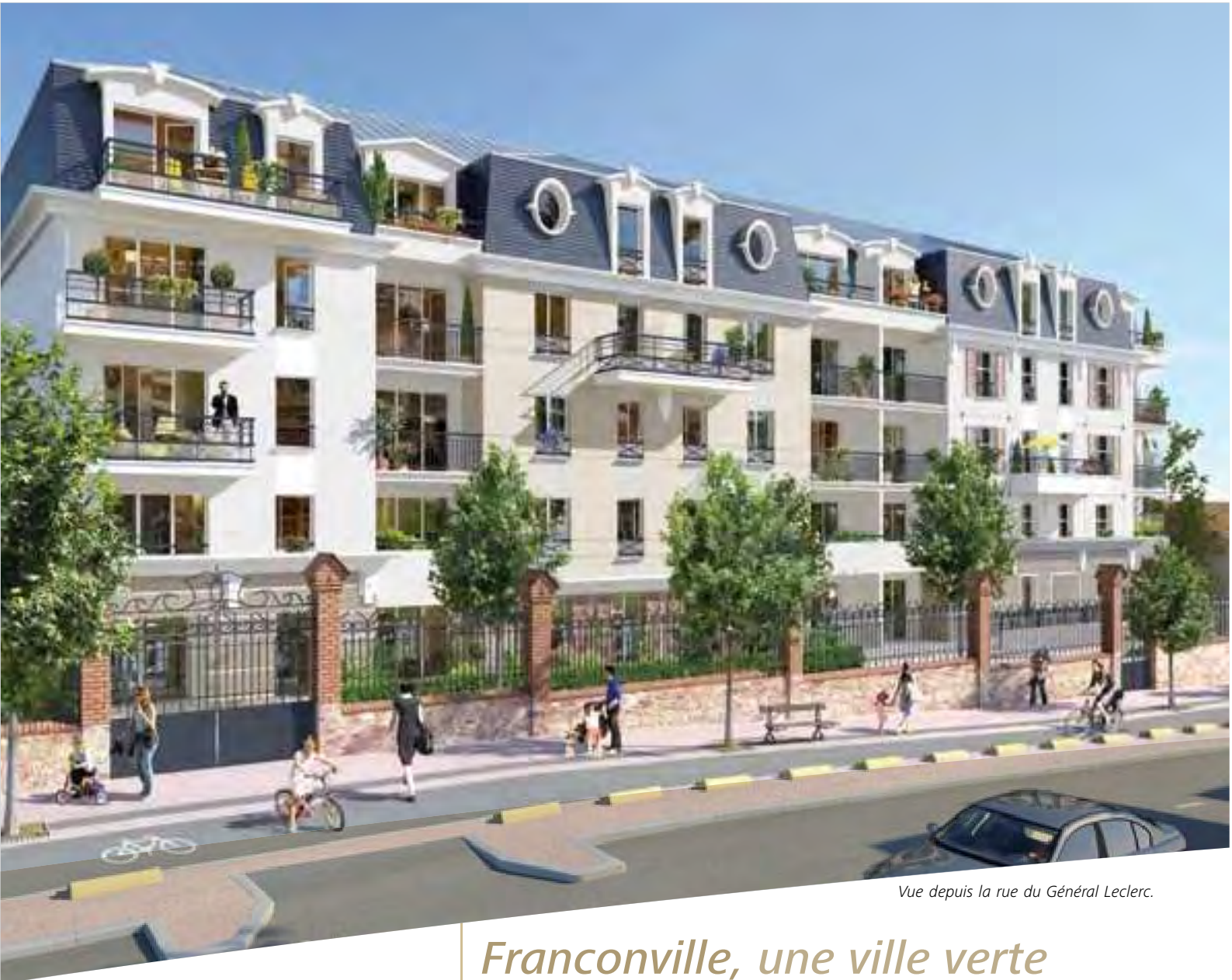
Vue depuis la rue du Général Leclerc.