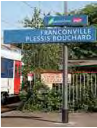
Gare RER Franconville - Plessis Bouchard

Tout près du bois de Cormeilles et du centre-ville, "Côté Parc" profite d'une situation idéale.