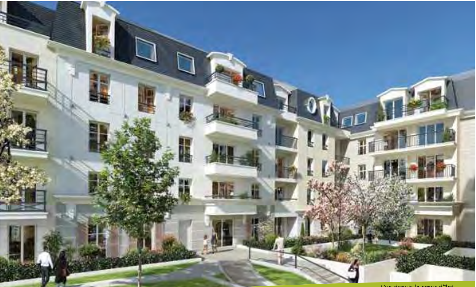
Vue depuis le cœur d'îlot.