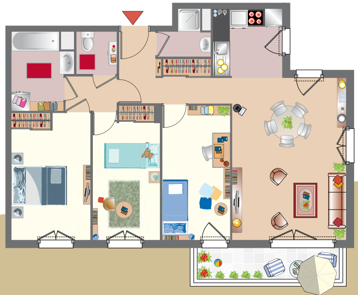
Exemple d'un 4 pièces 81,07 m 2 (lot D105) Lot vendu non meublé, selon stocks disponibles