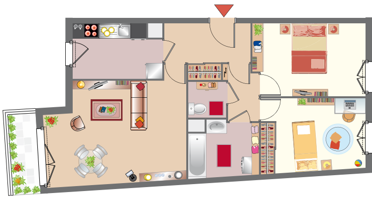
Exemple d'un 3 pièces 68,05 m 2 (lot D107) Lot vendu non meublé, selon stocks disponibles.