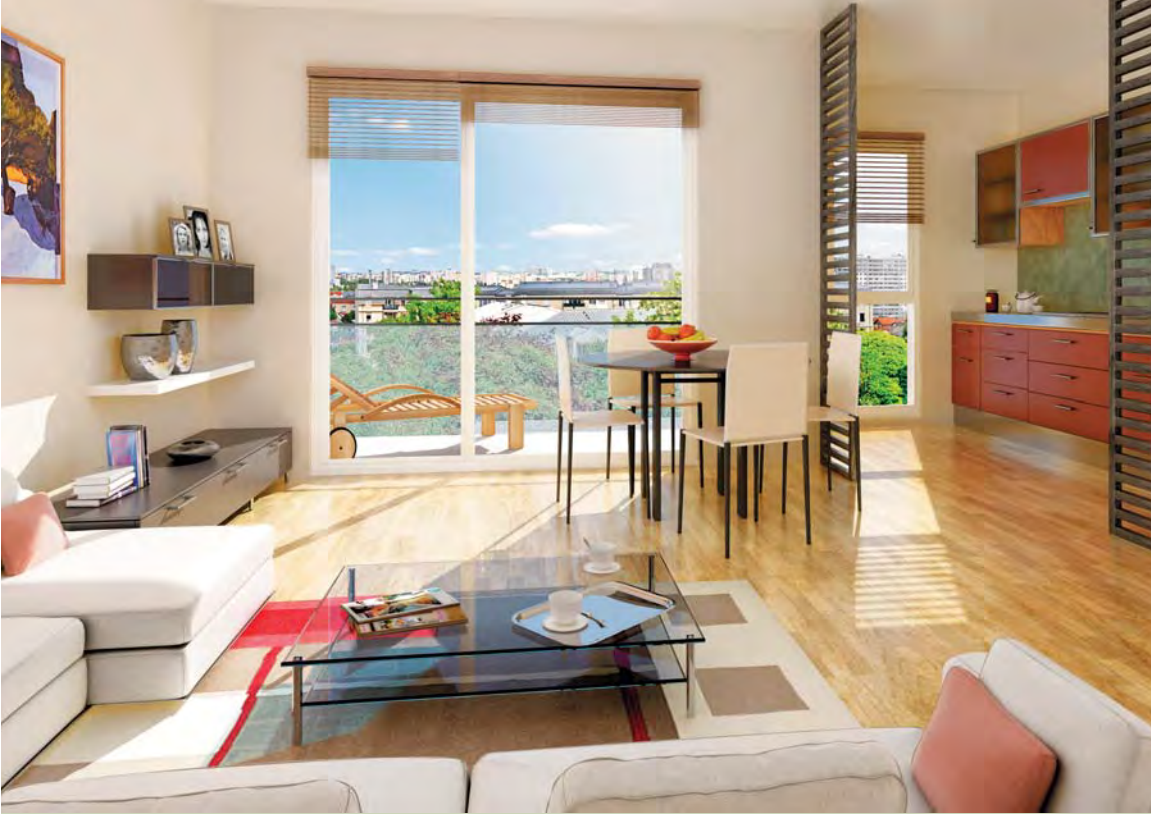
Exemple de 3 pièces (lot B441) 56,65 m 2 - Loggia : 4,05 m 2