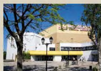
Théâtre de Saint-Maur.