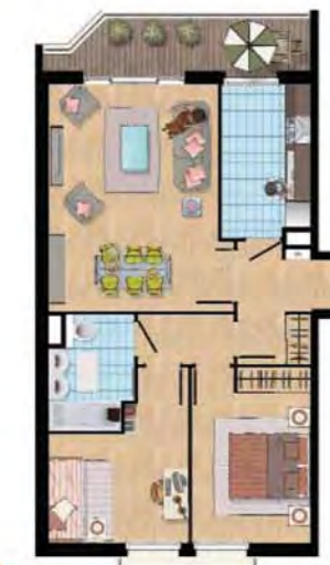
Exemple de 3 pièces