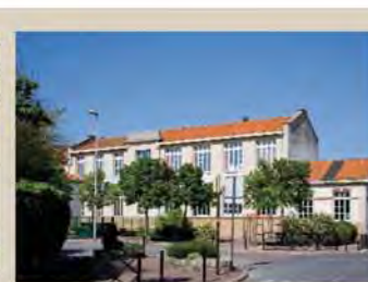
Groupe scolaire des Tilleuls.