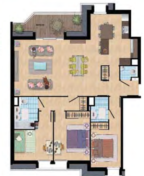
Exemple de 4 pièces