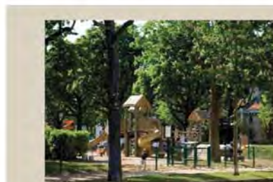
La Place des Marronniers.