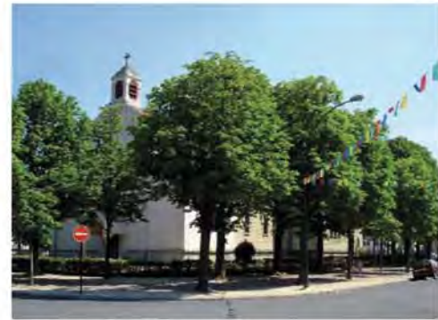
La Place des Marronniers et l'Eglise

B lotie naturellement dans une boucle de la Marne, Saint-Maur-des-Fossés a su préserver au fil du temps une qualité de vie rare.