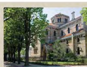
L'église Notre Dame du Rosaire.