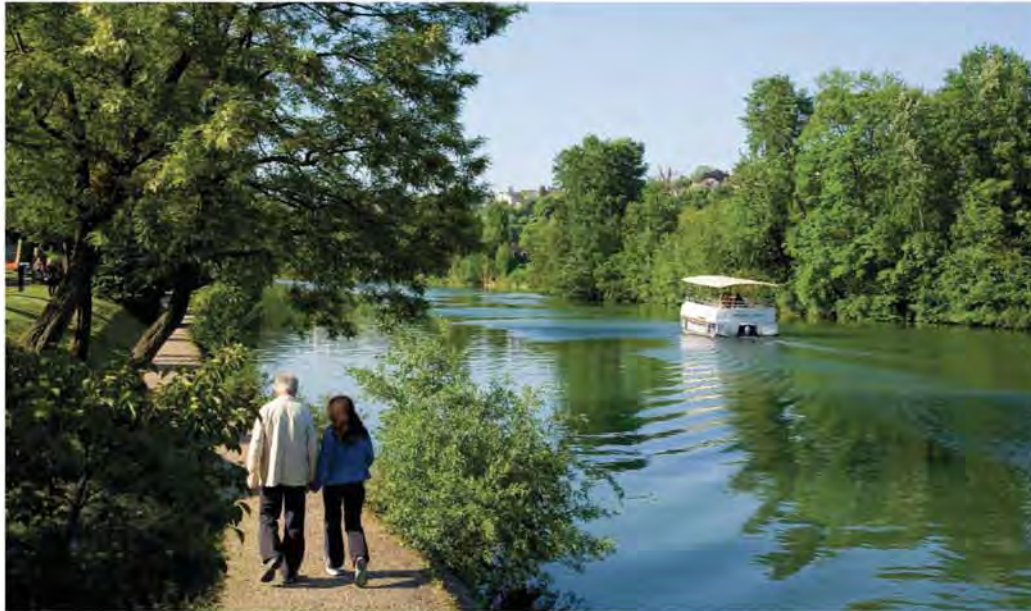
Promenades le long des bords de Marne.