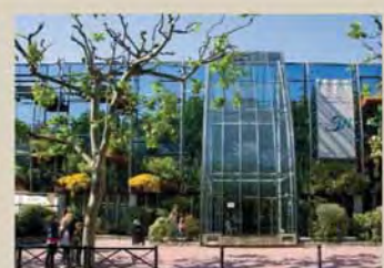
Centre sportif et piscine Pierre Brossolette.