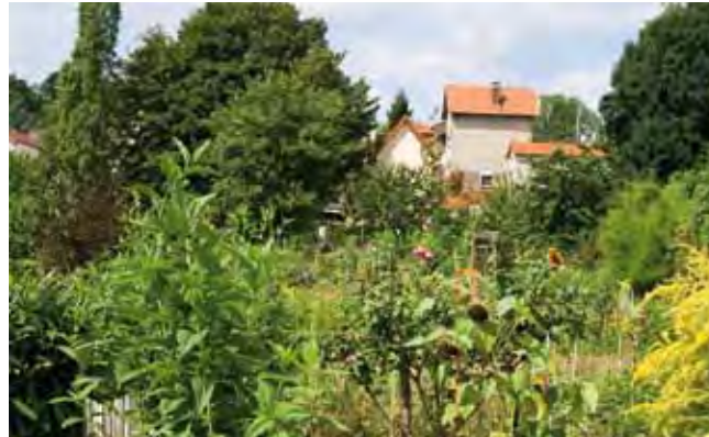
Les jardins familiaux de la rue Petit