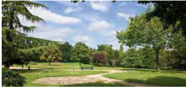
Parc de la République