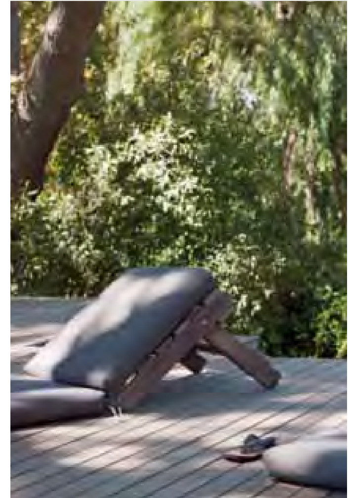
Rue de Paris