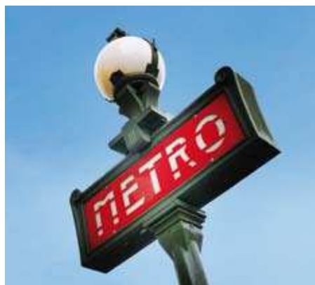
La station de métro