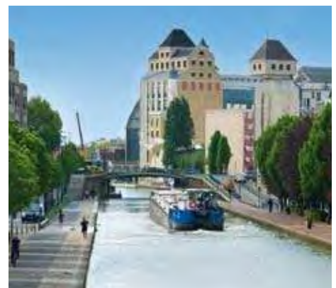
Le canal de l'Ourcq