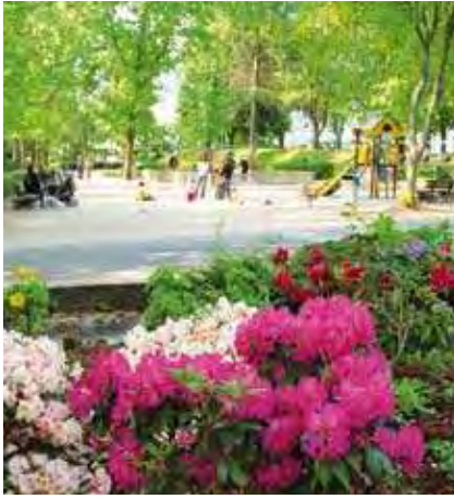
Le Parc Henri Barbusse

Idéalement situé à moins de 400 mètres du métro et tout proche de nombreuses lignes de bus, "L'Instant" vous offre l'opportunité de profiter de tous les avantages d'une vie de quartier facile et agréable. Commerces, écoles, collèges et lycées, squares et bibliothèques, tout est accessible à pieds. Proche du centre-ville et de ses marchés, entre espaces verts et petites maisons avec jardins, le quartier bénéficie d'une situation privilégiée pour conjuguer au quotidien convivialité et art de vivre.