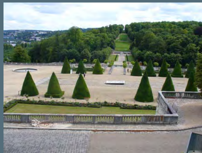
Parc de Saint-Cloud