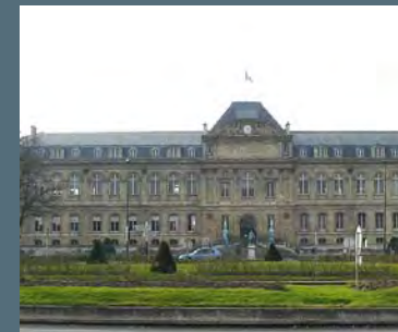
Musée de la céramique

Ancienne ville royale, la commune de Sèvres est réputée pour sa qualité de vie préservée à seulement 6 kilomètres de Paris.