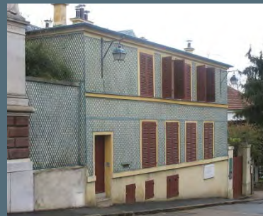
Maison des Jardies