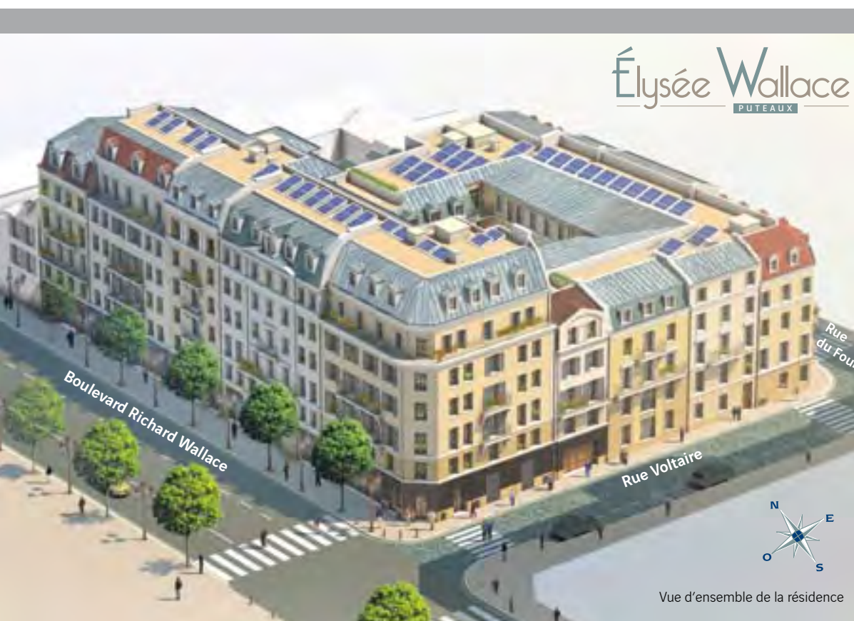
Vue d'ensemble de la résidence

Illustration à caractère d'ambiance non contractuelle. La représentation des prestations extérieures est indicative, se référer à la notice descriptive.