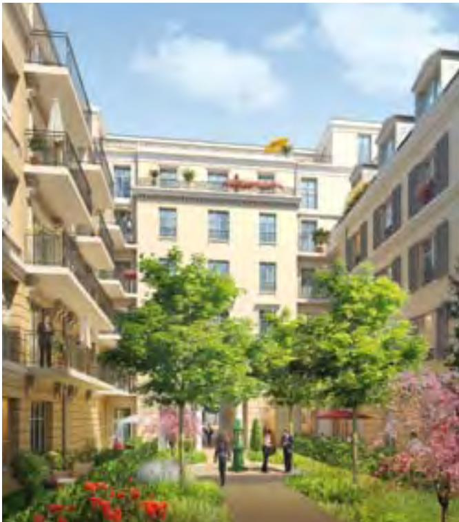
Illustration à caractère d'ambiance non contractuelle. La représentation des prestations extérieures est indicative, se référer à la notice descriptive.