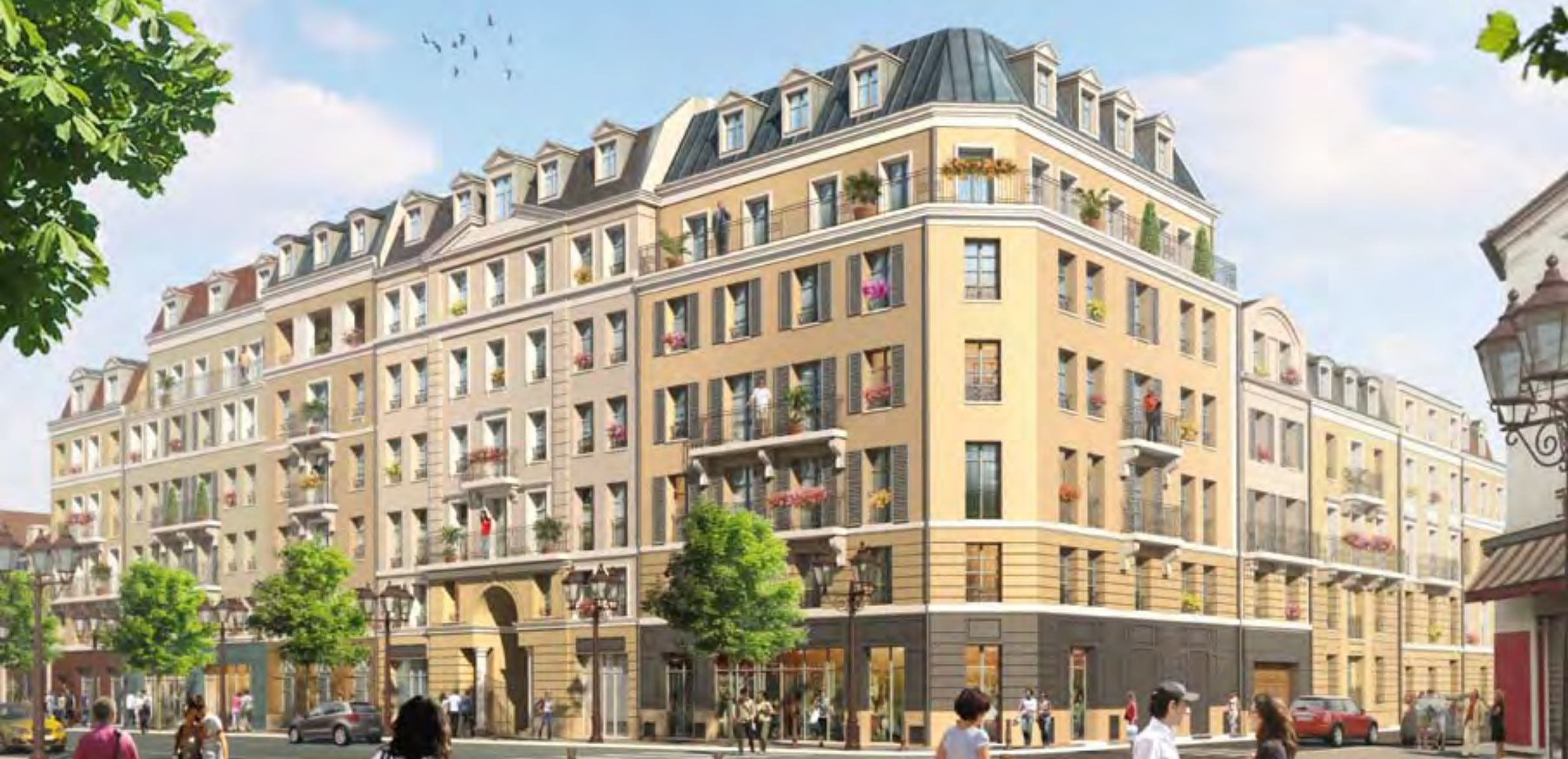
Illustration à caractère d'ambiance non contractuelle. La représentation des prestations extérieures est indicative, se référer à la notice descriptive.

Vue de la résidence à l'angle du boulevard Richard Wallace et la rue Voltaire