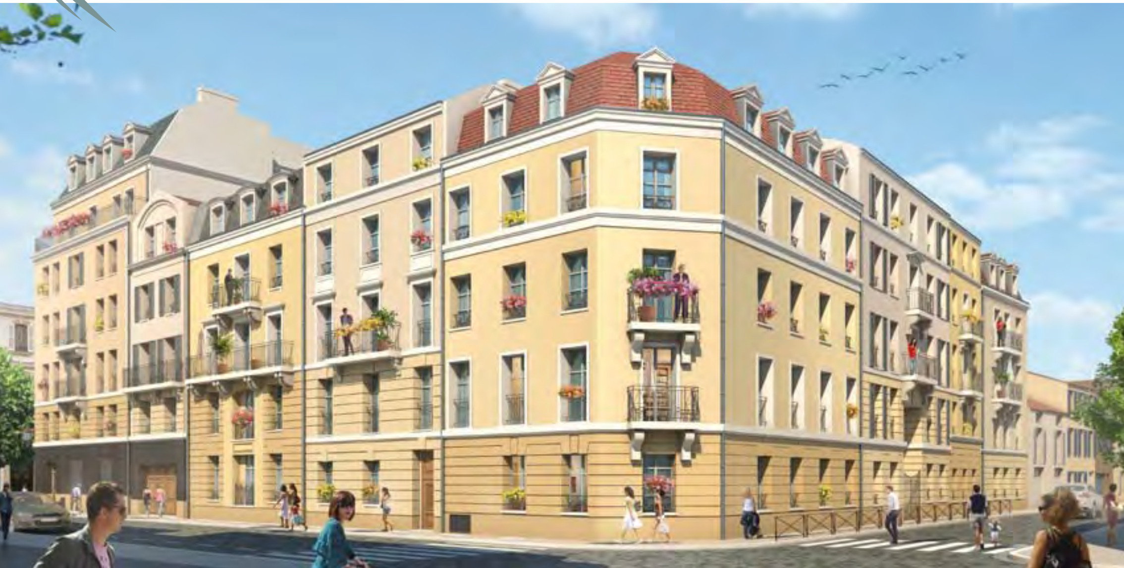
Illustration à caractère d'ambiance non contractuelle. La représentation des prestations extérieures est indicative, se référer à la notice descriptive.