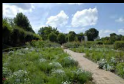
Vallée Rive gauche : aménagement des quais à partir de 2011