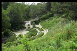
Parc de l'île Saint-Germain