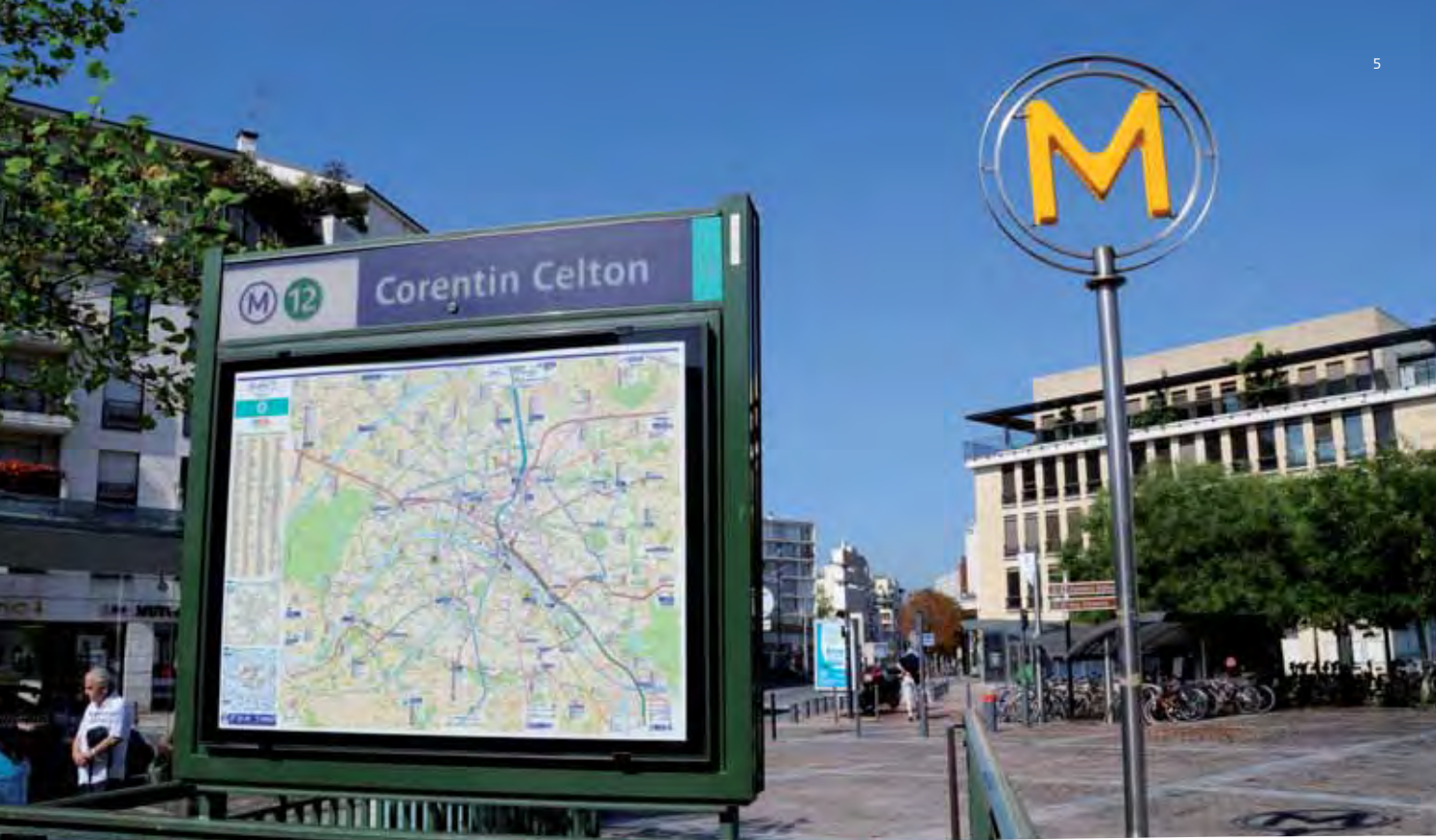
La place Corentin Celton