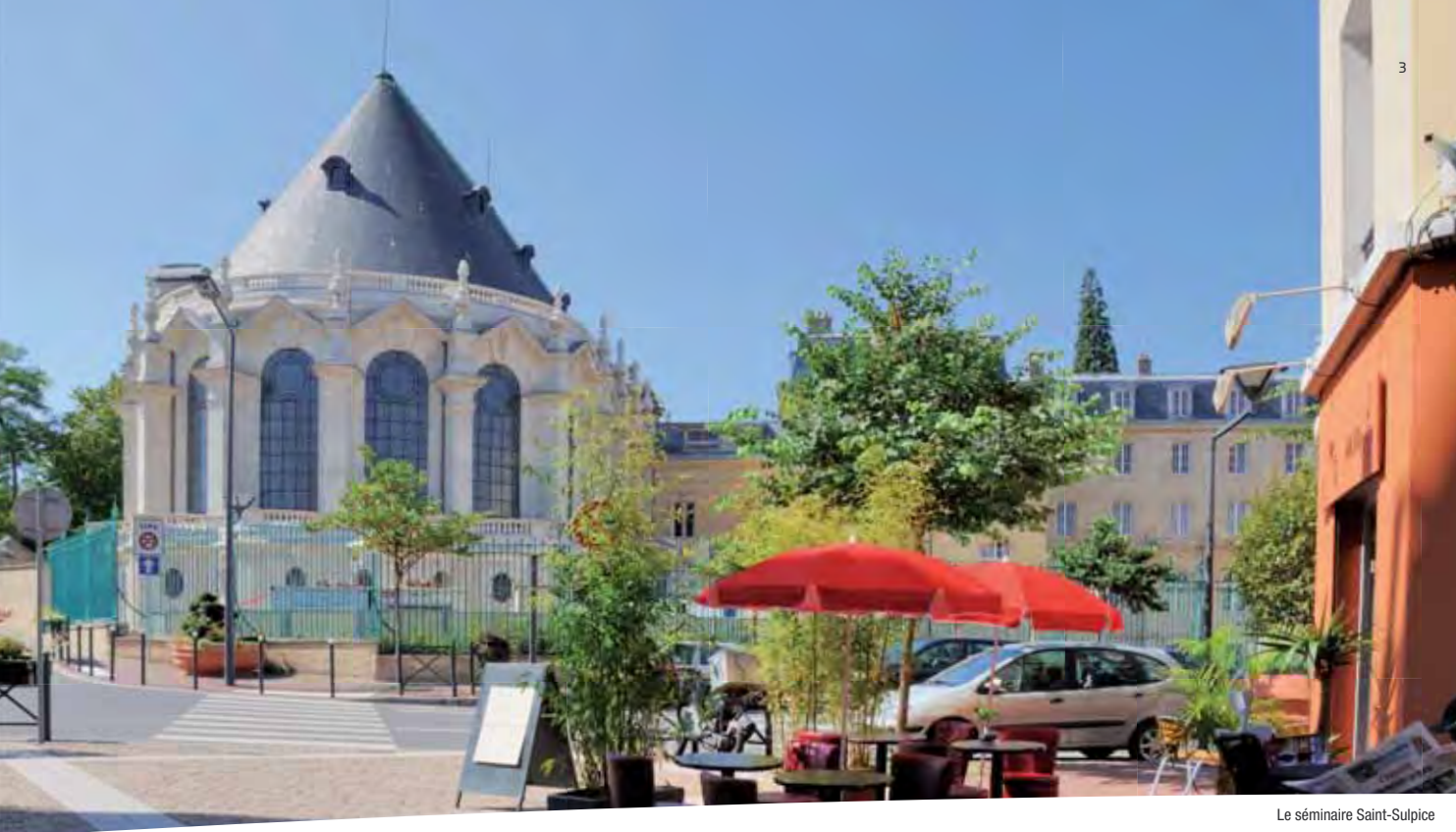
Le séminaire Saint-Sulpice