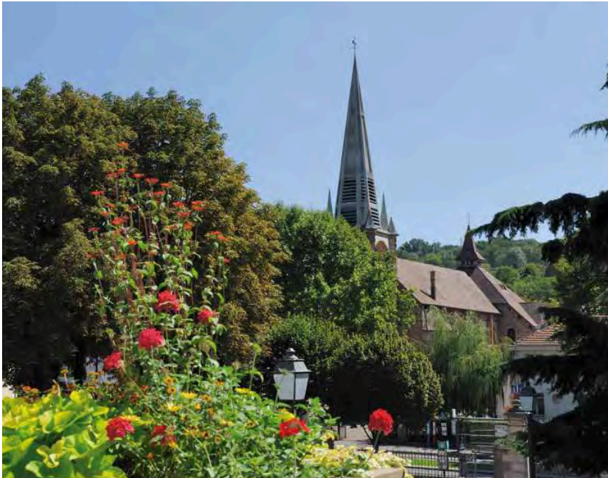
Notre-Dame-de-Lourdes vue depuis le parc de la mairie

Ancien domaine royal, Chaville offre un cadre de vie privilégié à ses habitants. Résidentielle par excellence, à proximité de Paris et de Versailles, elle se distingue par son patrimoine naturel exceptionnel. Les forêts domaniales de Meudon et de Fausses-Reposes, le parc forestier de la Mare-Adam et de nombreux espaces verts occupent en effet presque la moitié de son territoire.