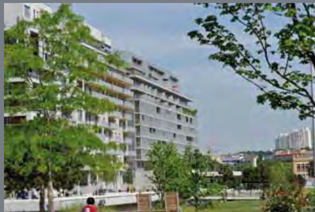
Rive de Parc - architecte : Agence Intégral LIPSKY ROLLET