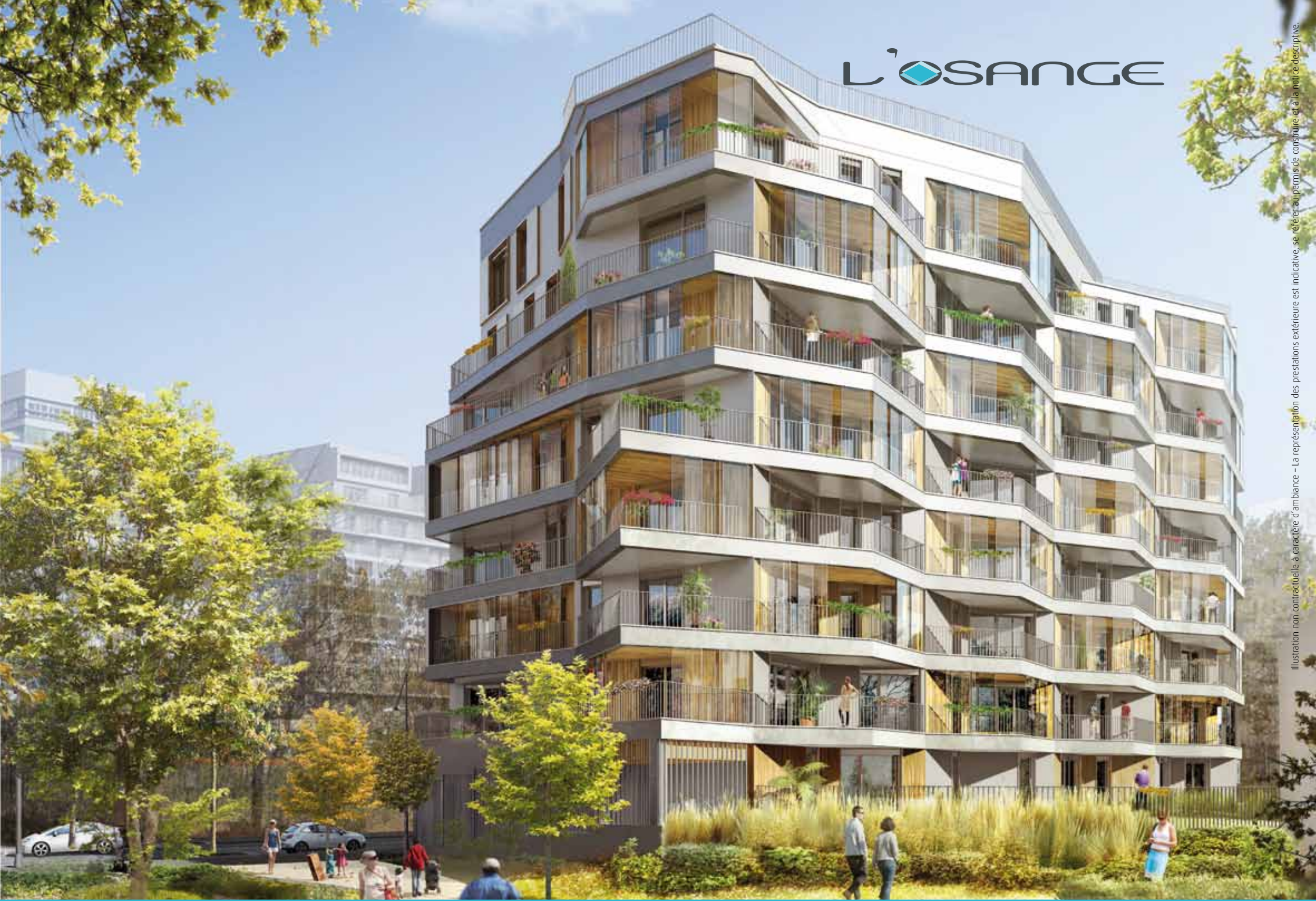
Illustration non contractuelle à caractère d'ambiance - La représentation des prestations extérieure est indicative, se référer au permis de construire et à la notice descriptive.