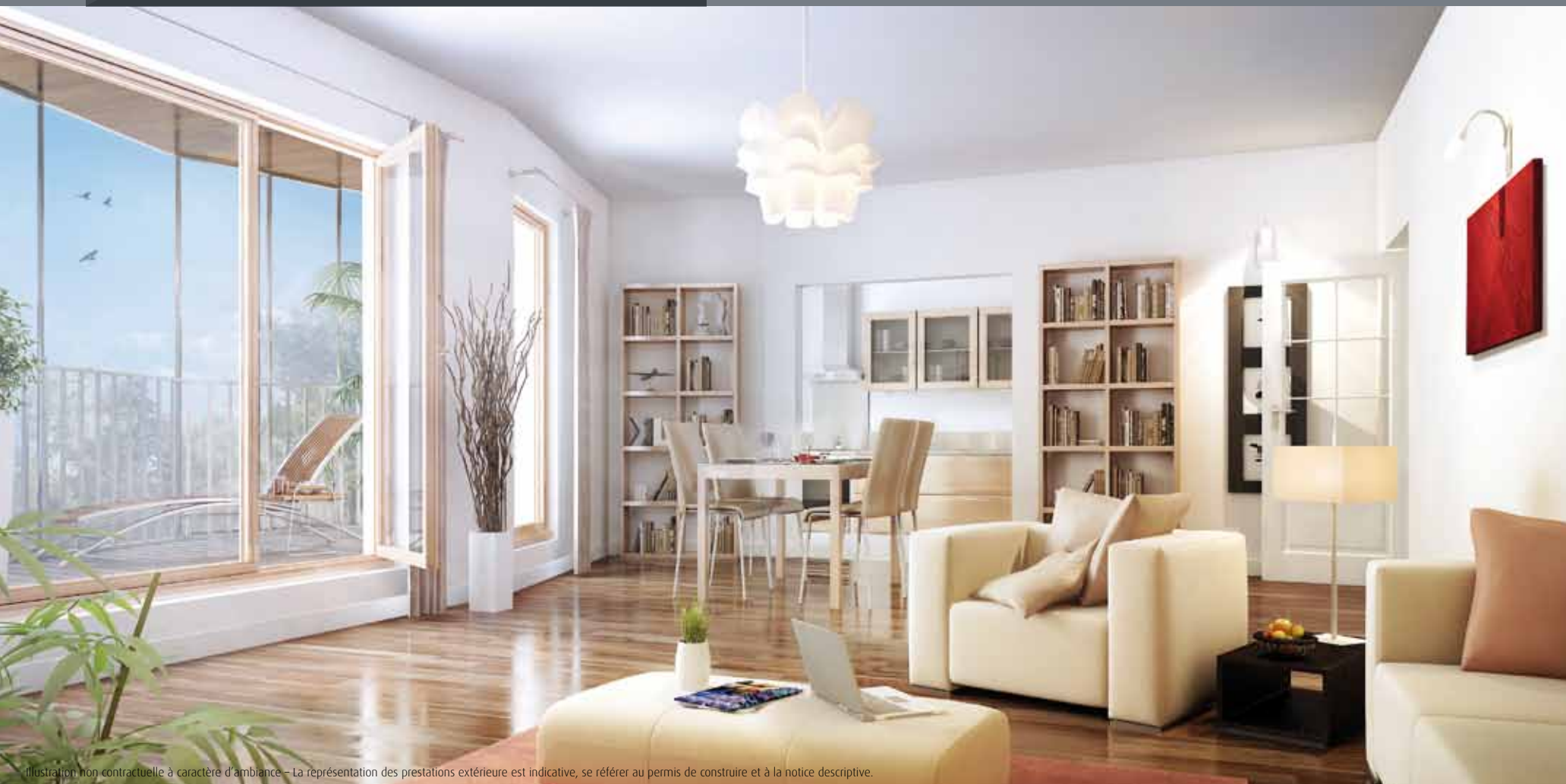
Illustration non contractuelle à caractère d'ambiance - La représentation des prestations extérieure est indicative, se référer au permis de construire et à la notice descriptive.

Généreusement vitrée, L'Osange élève son élégante façade de bois et d'enduit sur 7 étages. Le grand hall d'accueil, clair et spacieux, offre une respiration calme pour accéder aux appartements en rez-de-chaussée et en étage. Certains logements disposent de grandes baies vitrées, complétées par d'immenses panneaux de verre coulissants en fermeture de loggia. La lumière entre à flots dans chaque appartement, dessinant un espace unique et offrant un ensoleillement adapté tout au long de l'année, faisant de chaque loggia de véritable prolongement des pièces à vivre.