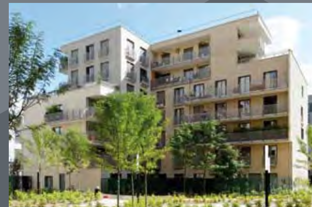
Revea City - architecte : Agence Meili Peter