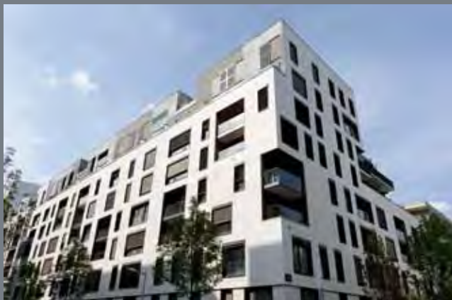
Idea City - architecte : Agence BROCHET Lajus Pueyo

Une qualité qui s'apprécie d'abord au présent et prend toute sa valeur avec le temps en intégrant la notion de développement durable.