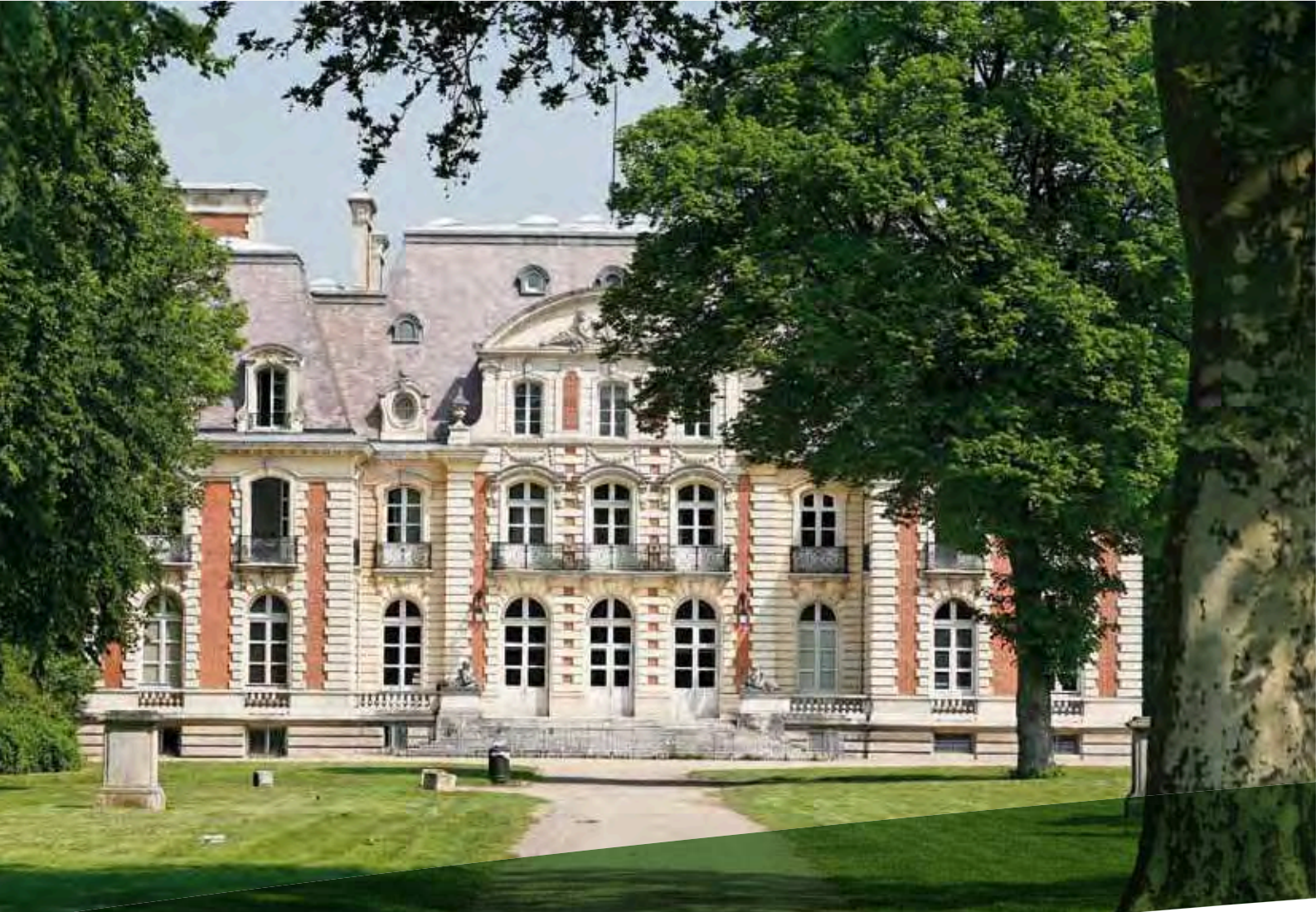
Le château de la Fontaine