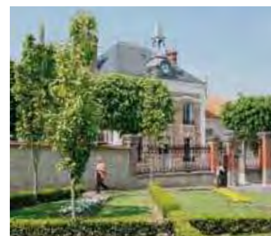
La place Chevier