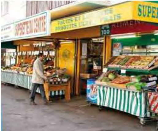
Un centre-ville animé

Parce qu'on le sait, dans la vie moderne, on a toujours l'impression de courir après le temps... "Secret Garden" vous propose de vivre dans un quartier agréable où l'essentiel est enfin accessible à pied. Les écoles, de la maternelle au collège, les espaces verts, le marché, le centre-ville, les commerces sont à portée de main et le RER n'est qu'à 700 mètres. Besoin de faire des courses ? La grande zone commerciale n'est qu'à 10 minutes en voiture.