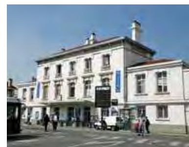
La gare SNCF

Car si Brétigny-sur-Orge a tout le charme et les atouts d'une vie de village, grâce à son patrimoine historique, ses marchés, ses promenades arborées et son agréable plan d'eau, elle n'en est pas moins très dynamique d'un point de vue artistique et sportif. La ville abrite en effet un théâtre, un Centre d'Art, une salle de concert, un cinéma d'art et d'essais et de nombreux gymnases et associations sportives. Une ode au bien-être, plébiscitée par l'ensemble des Brétignolais.