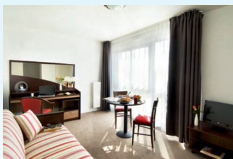
Nouvelle gamme de mobilier design et raffinée