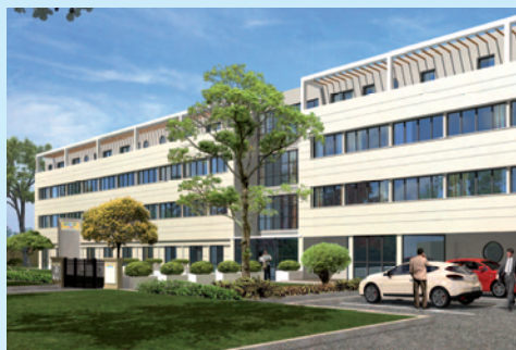
Appart'City® La Roche-sur-Yon