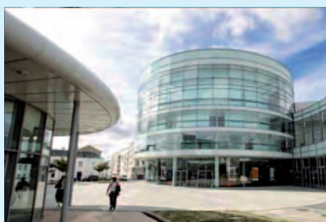
La ville accueille de nombreux entrepreneurs