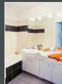
Cuisine équipée Salle de bains aménagée