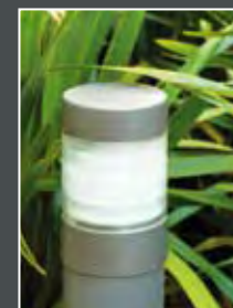
Luminaire extérieur Espaces verts paysagers Digicode