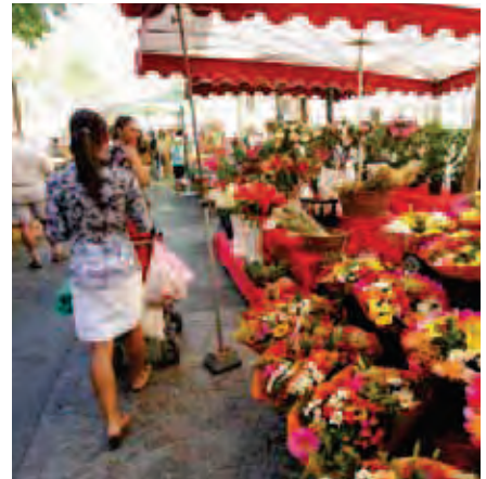
Le marché cours Lafayette

C'est à Saint-Jean-du-Var que nous réalisons votre future résidence. Situé à l'est de Toulon, à moins de trois kilomètres du centre-ville, ce quartier offre un cadre de vie calme et confortable bientôt desservi par le tramway. Mélange d'habitat ancien, de petites copropriétés récentes et de villas provençales, Saint-Jean-du-Var cultive un art de vie certain. A proximité d'une grande artère commerçante, du pôle universitaire, des écoles mais aussi des crèches, d'un gymnase, de La Poste et des accès autoroutiers, ce quartier bénéficie d'une situation idéale pour profiter de la ville en toute quiétude.