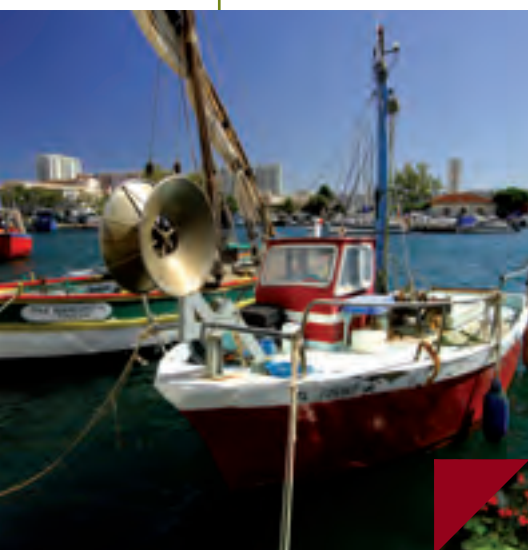
► Le port

Ecole maternelle Saint-Jean du Var (300 m) - Ecole élémentaire Dominique Mille (600 m) - Collège Django Reinhardt (1,2 km) - Lycée Polyvalent Régional Dumont Urville (1,5 km) - Lycée des Métiers de l'Hôtellerie et du Tourisme (2 km) - Lycée Professionnel du Parc Saint-Jean (1 km) - Institution Notre-Dame – collège et lycée (500 m) - Plage du Mourillon (2,7 km) - Plage de la Mitre (2,9 km) - Gymnase et stades municipaux - Stade Félix Mayol - Centre commercial Leclerc - Supermarché Champion - Centre hospitalier intercommunal (1,4 km)