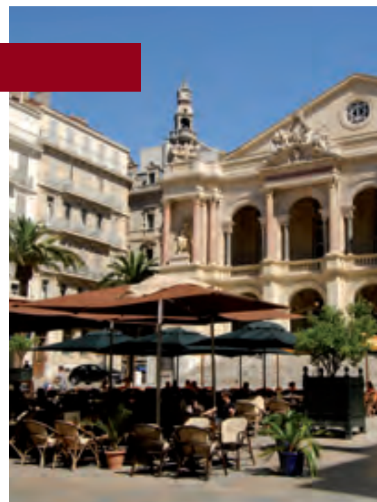
► Le théâtre

Ouverte sur la mer et dominée par le Mont Faron, Toulon se pare d'un bel environnement végétal, boisé et fleuri. La vieille-ville et ses jardins, le quartier du Mourillon et ses plages, l'Arsenal et les ports de plaisance sont autant de lieux mythiques que vous aurez plaisir à fréquenter. Haut-lieu du commerce maritime depuis l'Antiquité, reconnue comme la plus belle rade d'Europe depuis le 18e siècle, ville de départ des grandes expéditions maritimes... Toulon a conservé la mémoire de son histoire et concilie harmonieusement les vestiges d'hier et les promesses de demain.