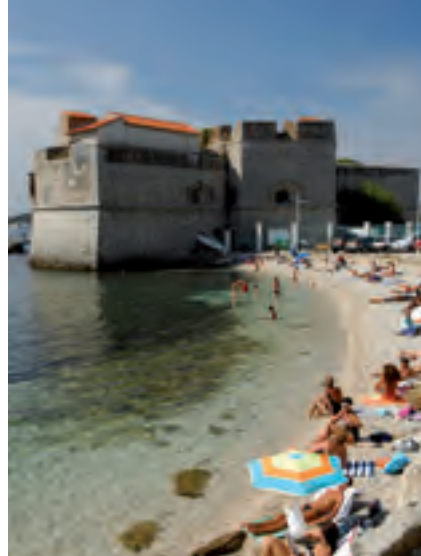
► La plage du Mourillon

Depuis plusieurs années, la mise en valeur du centre ancien et de la haute ville a considérablement embelli Toulon. De même, le Zénith, le Centre de Congrès et le Palais des Sports accueillent de grands événements culturels, économiques et sportifs. L'arrivée à échéance des grands projets d'infrastructures renforcent l'attractivité du territoire toulonnais. Déjà desservie par le TGV Méditerranée qui met Paris à 4 heures du grand Sud, Toulon bénéficiera bientôt d'une nouvelle traversée souterraine pour relier l'A50 à l'A57 (dans le sens Marseille vers Nice). En 2014, le tramway complètera le réseau de bus de l'agglomération. Vos déplacements urbains s'en trouveront ainsi facilités. Lieu de travail, commerces ou plages deviennent accessibles en un rien de temps !