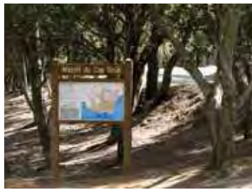
Massif du Cap Sicié