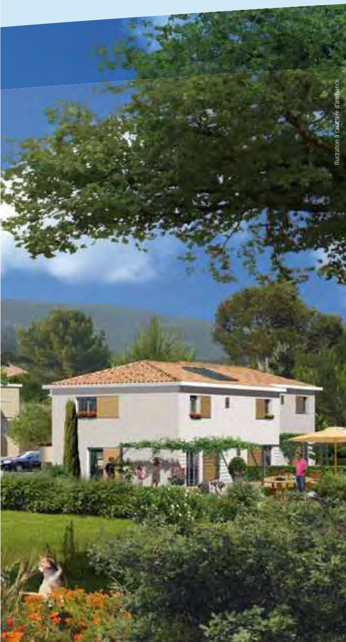
Illustration à caractère d'ambiance.

(3) Répondant à la réglementation thermique de 1975.