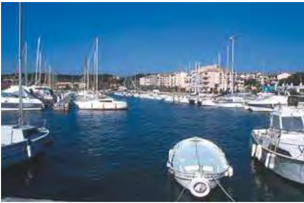
Le port de plaisance de Six-Fours

Une situation idéale confortée par la proximité des axes autoroutiers.