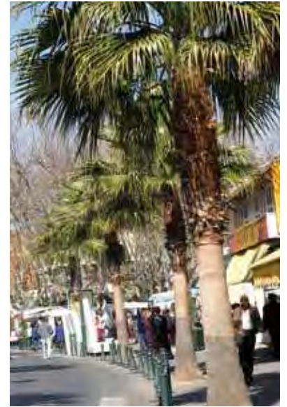
Avenue de la République