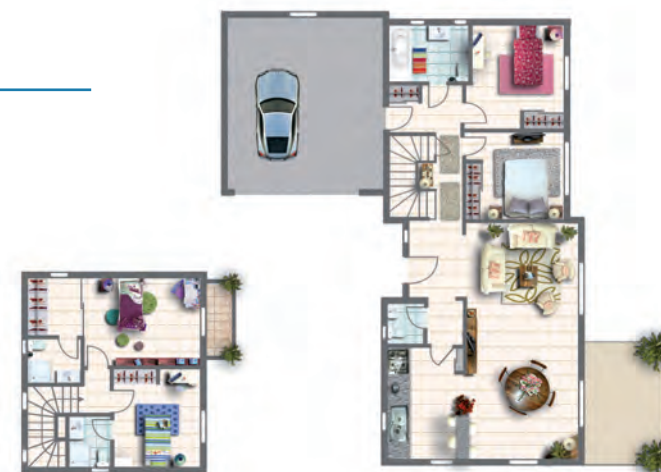
Exemple de plan