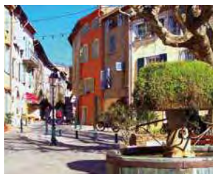
Le centre du village

Tous les atouts sont réunis à Cogolin pour vous offrir une réelle qualité de vie.