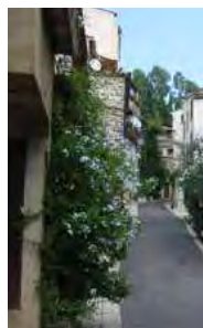
Une ruelle typique