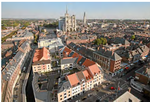
La cathédrale d'Amiens

A proximité d'Amiens, le pôle mondial « Industries et Agro-Ressources » rassemble les acteurs de la recherche, de l'enseignement et de l'industrie autour d'un axe commun : la valorisation alimentaire du végétal. Le pôle ambitionne de devenir la référence européenne en culture végétale innovante à l'horizon 2015.