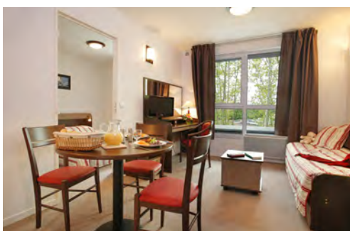
Gamme de mobilier contemporain

A 50 minutes de la côte, Amiens s'ouvre sur les plages sauvages de la baie de Somme et les villages pittoresques. Le littoral offre d'innombrables promenades. Classée Ville d'Art et d'Histoire, Amiens s'exprime au travers de son architecture. Sa cathédrale est la plus vaste de France par ses volumes intérieurs ; elle est deux fois plus vaste que Notre-Dame de Paris. La ville est créative avec ses orchestres, ses festivals de jazz, de cinéma et des arts de la rue. Amiens accueille également des compétitions internationales grâce à des équipements sportifs prestigieux : Stade de la Licorne, Palais des Sports, etc.