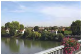
Bords de Seine

S artrouville conjugue le charme des berges de la Seine où il fait bon se promener. L'activité dynamique des plus vastes bassins d'emplois de la région parisienne est accessible en une dizaine de minutes. La deuxième ville des Yvelines vous offre à la fois une vie au vert, entre ses 70 hectares d'espaces verts soignés (le Parc de Maisons-Laffitte et la Forêt Domaniale de Saint-Germain-en-Laye) et une vie animée, commerçante (l'avenue Maurice Berteaux) et moderne (proximité de La Défense et des Champs-Élysées). Ouverte sur la vie et sur la nature, Sartrouville est le cadre idéal d'une vie de famille harmonieuse qui ne pourra que s'épanouir.