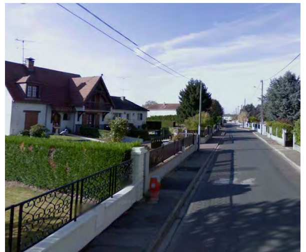
Rue de Boissise

Saint-Fargeau Ponthierry est l'une de 57 communes que couvre le Parc naturel régional du Gâtinais français permettant ainsi de conjuguer qualité de vie verdoyante et développement économique et social via «Le Réaménagement des Bords de Seine».