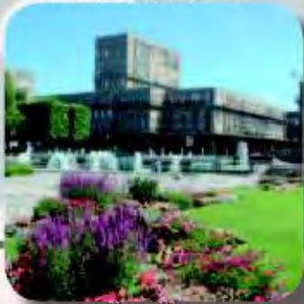
Jardin de l'Hotel de Ville