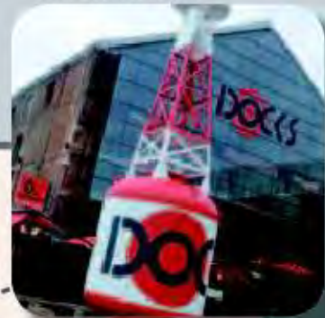
Centre commercial Les Docks Vauban