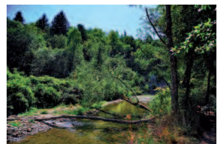
La Ménége traverse la commune