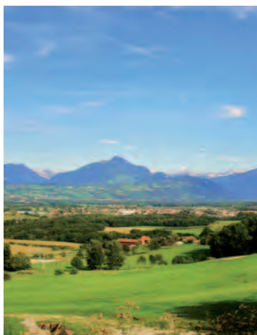
Vue sur le Salève depuis Vetraz-Monthoux

Idéalement située entre le cœur du village de Vetraz-Monthoux et l'entrée d'Annemasse, « VERT EDEN » procure immédiatement un profond sentiment de tranquillité. Bordant la route de Collonges, la résidence profite d'un environnement à taille humaine, résidentiel et propice à la sérénité. Complétée par la vue lointaine sur le Salève, l'atmosphère est ici apaisante et pratique tout à la fois. Faire ses courses ou emmener les enfants à l'école située à quelques centaines de mètres, comme se balader dans les rues d'Annemasse, déposer les plus grands au collège, ou faire ses achats dans les grandes enseignes commerciales de l'agglomération, tout est facilement et rapidement accessible. Un atout maître qui marque le passage de la ville à la campagne.