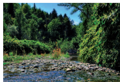
La Ménoge traverse la commune