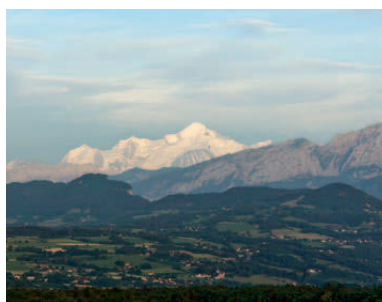
Vue sur le Mont-Blanc depuis Vétraz-Monthoux