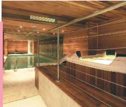
Espace piscine et jacuzzi