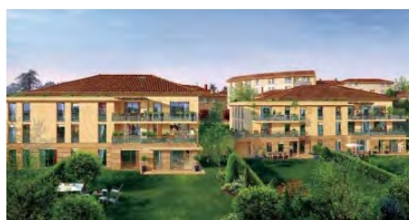
Le Clos du Colombier FRANCHEVILLE (69) Résidence de 44 logements

Forte de ses différentes résidences réalisées, Artebat a acquis une véritable maîtrise dans l'élaboration et la réalisation de projets immobiliers. Tournée vers l'avenir, Artebat est très attachée aux nouvelles techniques ainsi qu'à l'environnement.