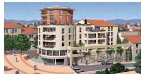
La Passerelle VILLEFRANCHE-SUR-SAÔNE (69) Résidence de 32 logements et bureaux