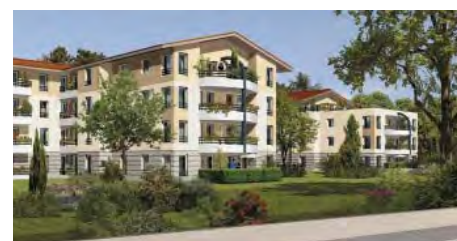
Les Frontalières GAILLARD (74) Résidence de 78 logements