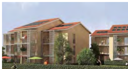
Les Jardins du Mail FOUR-VILLAGE (38) Résidence de 42 logements