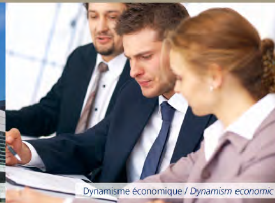
Dynamisme économique / Dynamism economic