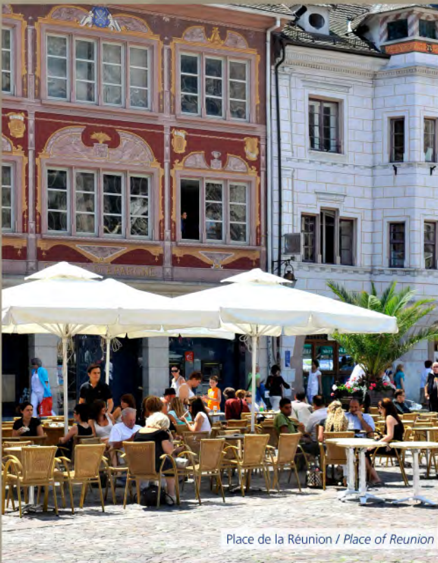
Place de la Réunion / Place of Reunion

Property Investment in French City Centres The Creator of Complementary Income