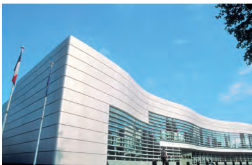
La Filature, témoin d'une ville dynamique

Mulhouse est le 2 ème pôle économique d'Alsace après Strasbourg et le 2 ème territoire français pour les emplois liés à l'automobile, avec 90 000 salariés et 700 000 véhicules produits par an. L'usine PSA Peugeot-Citroën de Mulhouse est le 1 er employeur de la région. Reliée aux bassins d'activités européens, Mulhouse est un carrefour de compétences : chaque jour, 330 000 français traversent les frontières du nord et de l'est. Mulhouse, c'est aussi un modèle économique engagé : l'industrie y prône un capitalisme à visage humain. Côté innovation, la ville est le siège du Rhénatic, pôle TIC qui regroupe 110 entreprises, 8 laboratoires et 450 chercheurs. Mulhouse développe 3 pôles de compétitivité labellisés : véhicules du futur, innovations thérapeutiques et fibres naturelles.