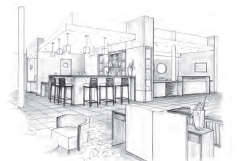
Le bar Lounge de la résidence

Modèle de nombreuses cités-jardins, Mulhouse est une des anciennes villes industrielles les plus florissantes de France.