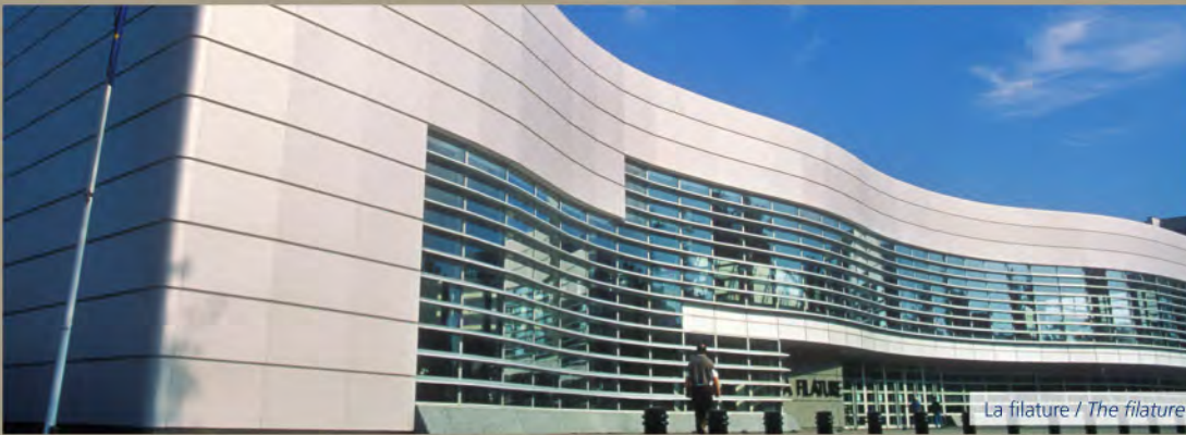
La filature / The filature