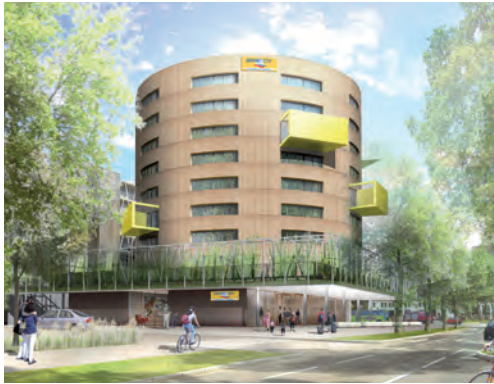
Appart'City® Premium Mulhouse