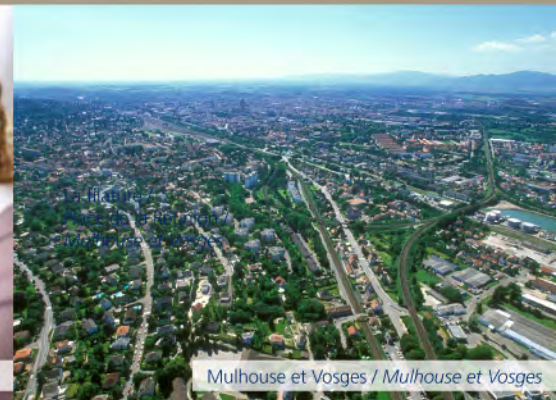
Mulhouse et Vosges / Mulhouse et Vosges