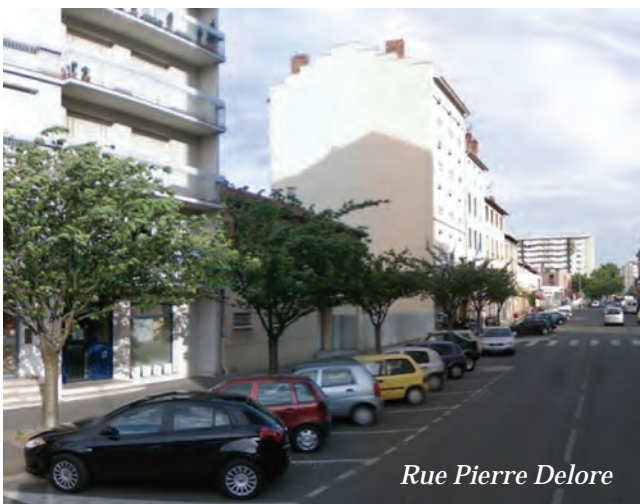
Rue Pierre Delore