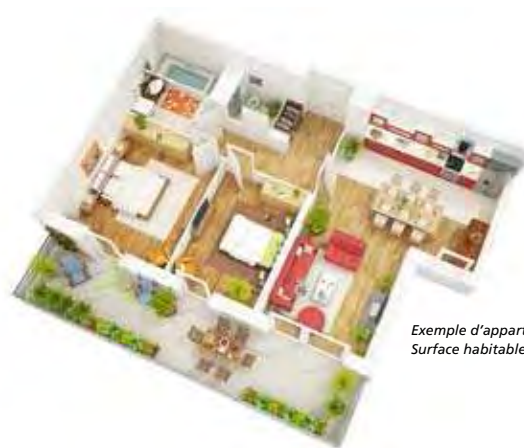
Exemple d'appartement T3 - N° lot la 605 Surface habitable : 64,50m 2 , balcon : 18,75m 2