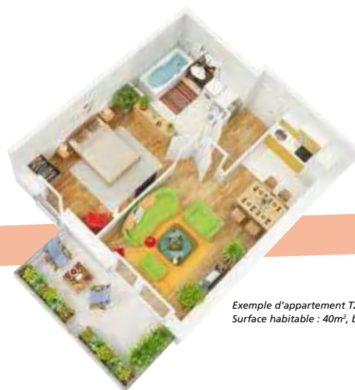
Exemple d'appartement T2 - N° lot la 506 Surface habitable : 40m 2 , balcon : 8,67m 2