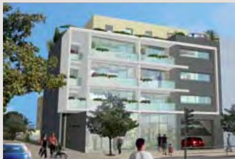
L'Opalia - Castelnaud-le-Lez