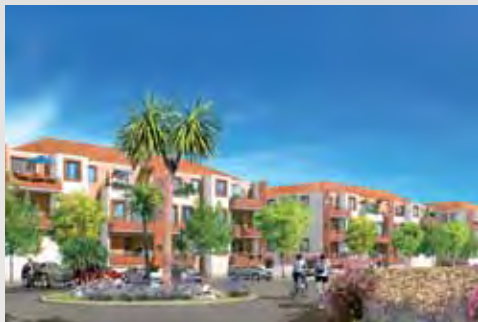
Domaine d'Estany - Cabestany