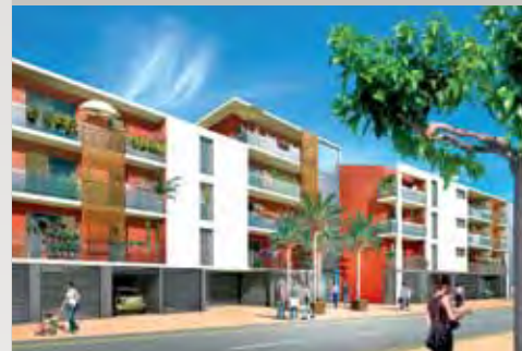
Casa Real - Perpignan