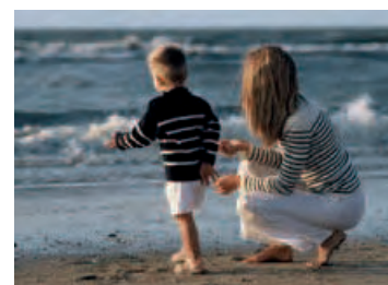
Les Plages de Canet-en-Roussillon