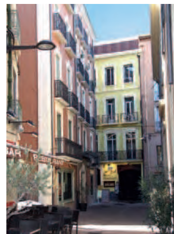
Ruelle du vieux Perpignan