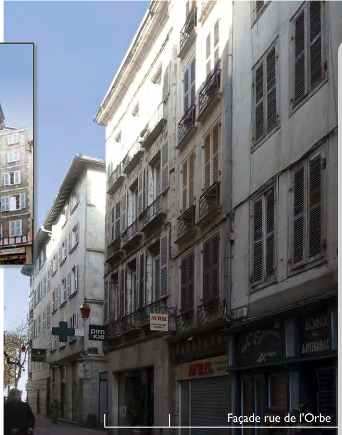
Façade rue de l'Orbe