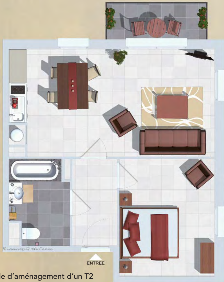
Exemple d'aménagement d'un T2