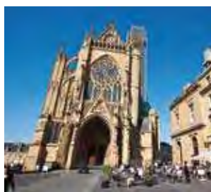
La Cathédrale Saint-Etienne

Fière de son dynamisme actuel, Metz n'oublie pas pour autant la qualité de vie de ses résidents et a créé plus de 70 km d'équipements cyclables dans toute l'agglomération et 1 150 places de stationnement de vélos. Menant depuis de nombreuses années une politique pionnière en matière d'écologie urbaine, la municipalité transforme peu à peu l'antique cité marchande en «ville piétonne et jardin» égrenant son paysage urbain et architectural au fil des rivières, des lacs et des parcs.