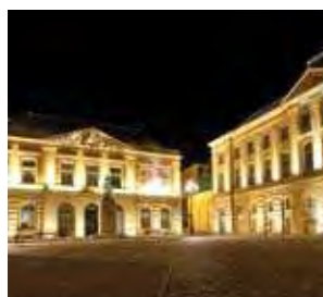
L'Hôtel de Ville et l'Office du Tourisme