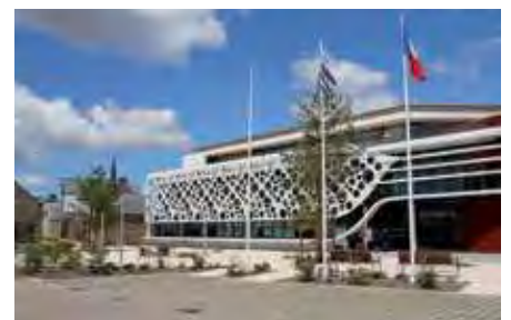
La nouvelle Marie de Plescop