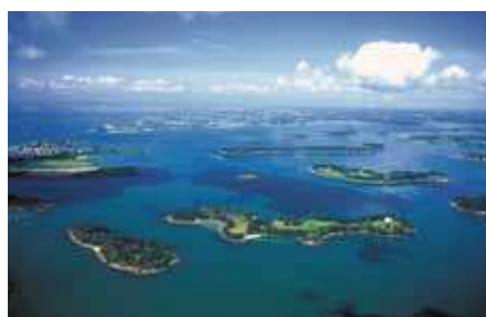
Golfe du Morbihan