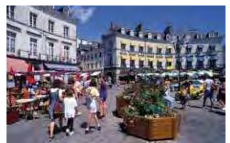
Centre historique de Vannes