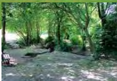
Espace vert "Fontaine St-Simon"