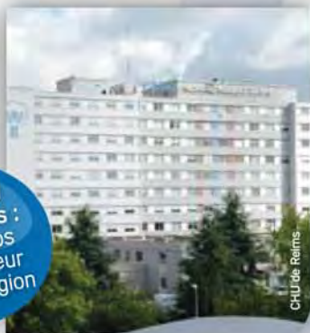
CHU de Reims

Le CHU de Reims : plus gros employeur de la région