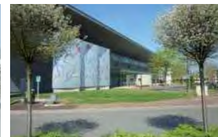
Le Centre sportif du Larry