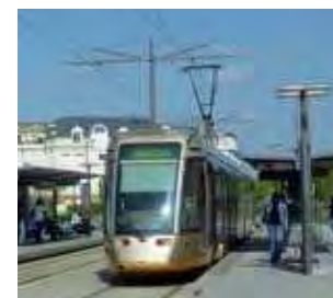
Le Tramway "Ligne A", station Victor Hugo