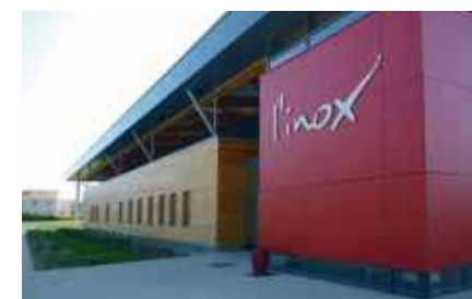
"L'Inox", la nouvelle piscine

Au cœur du réseau routier et autoroutier de l'agglomération, la ville profite aussi d'un ensemble de transport en commun symbolisé par le tramway qui permet de gagner le centre d'Orléans en 10 minutes.