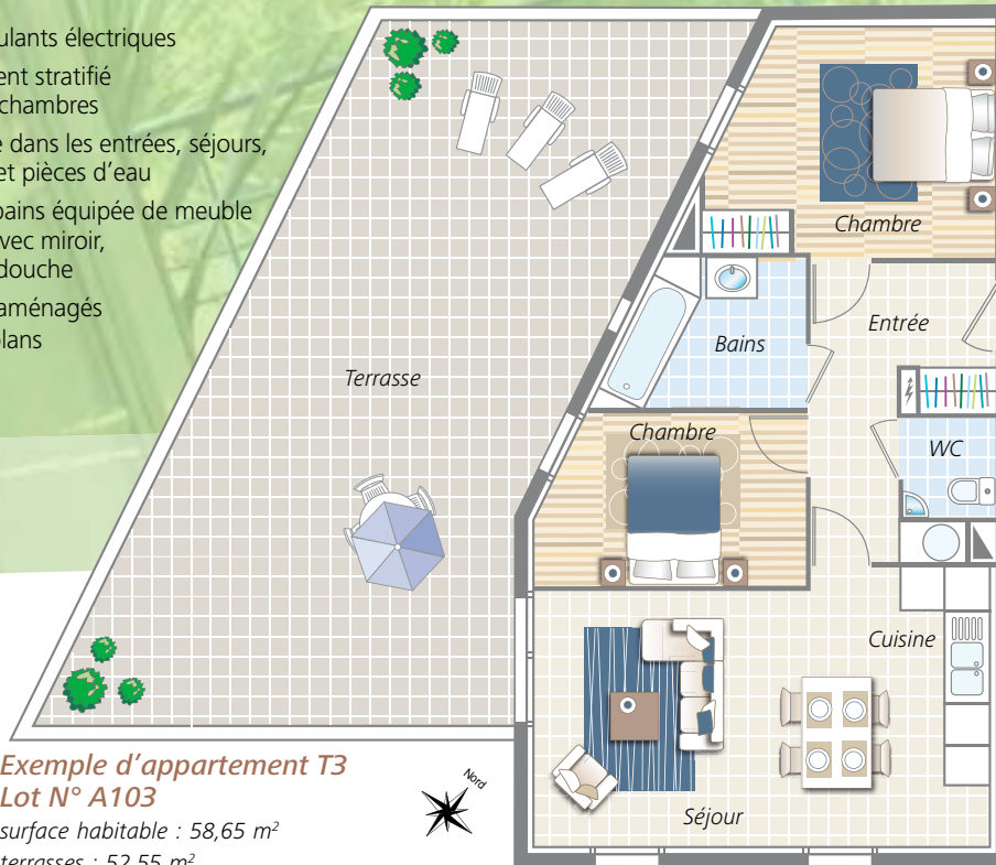
Exemple d'appartement T3 Lot N° A103 surface habitable : 58,65 m 2 terrasses : 52,55 m 2