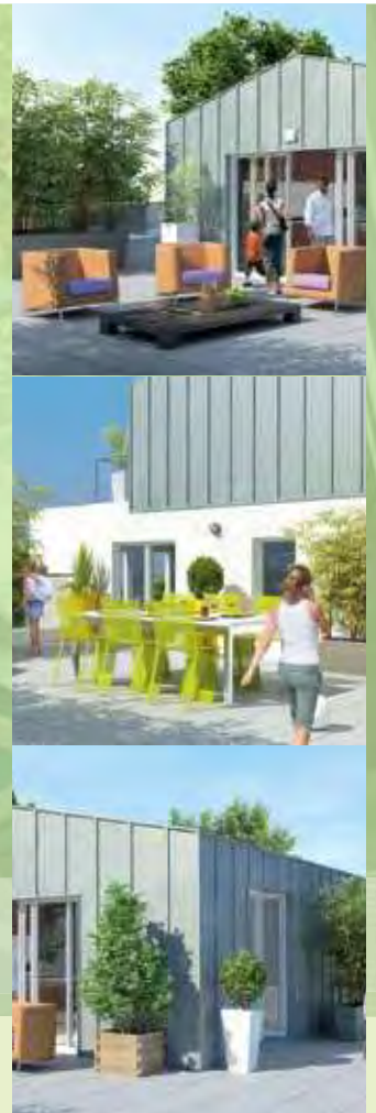
Dans la limite des stocks disponibles. Les logements sont vendus et livrés non aménagés et non meublés.