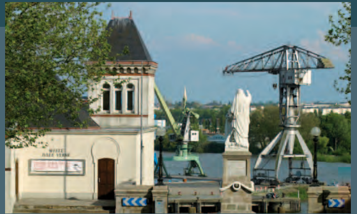
La butte Sainte-Anne et le Musée Jules Verne

Opalescence semble un endroit propice pour mener une vie équilibrée: au quotidien, il suffit de quelques minutes pour rejoindre en voiture le centre commercial Atlantis; en aussi peu de temps, le périphérique voisin est une invitation à prendre le large vers des horizons balnéaires.