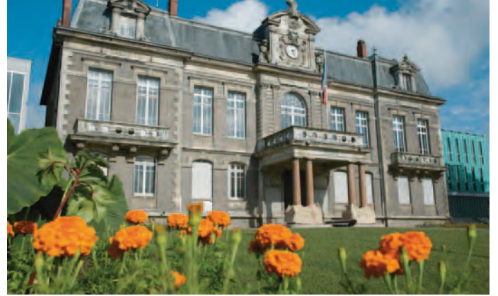
La mairie de Chantenay

Situé à la confluence des quartiers Chantenay et Zola, Opalescence offre les bénéfices d'une situation pratique pour les équipements de proximité et d'ouverture vers l'extérieur pour profiter d'une palette de services multiples.