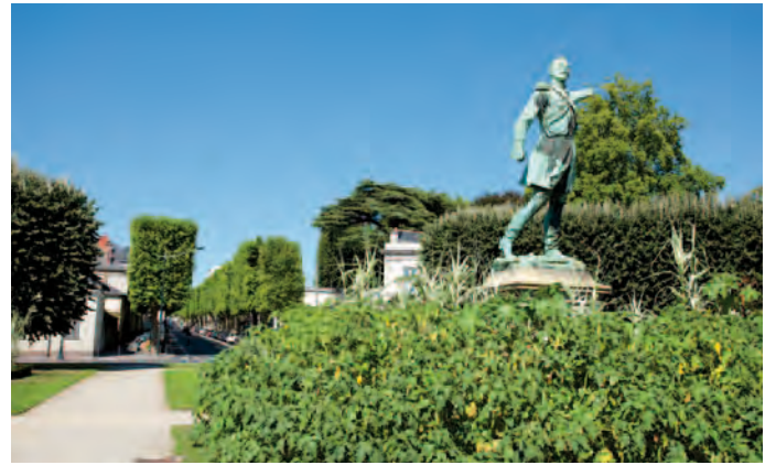
La place Mellinet

Situé à la confluence des quartiers Chantenay et Zola, Opalescence offre les bénéfices d'une situation pratique pour les équipements de proximité et d'ouverture vers l'extérieur pour profiter d'une palette de services multiples.