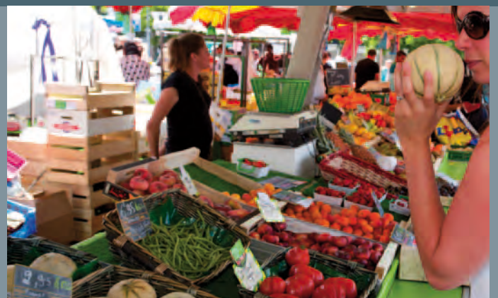
Le marché Zola à portée de la résidence

Le stade de la Durantière offre des activités sportives à tous les passionnés