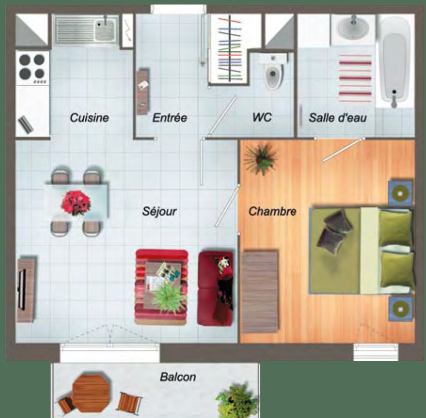
Exemple d'appartement T2 Surface habitable : 41 m 2

Chaque détail a fait l'objet d'une attention particulière pour offrir aux résidents un cadre de vie dans lequel il fait bon et beau vivre.