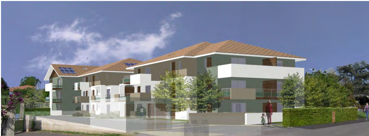
Illustration libre de l'artiste, document non contractuel