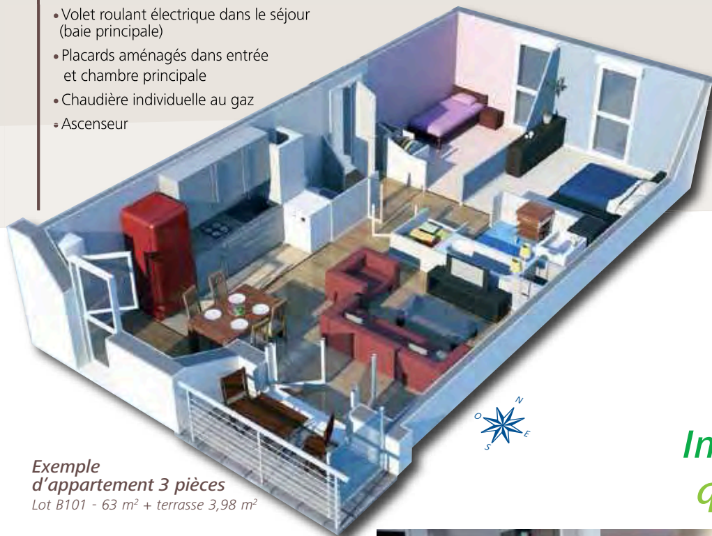
Exemple d'appartement 3 pièces Lot B101 - 63 m 2 + terrasse 3,98 m 2