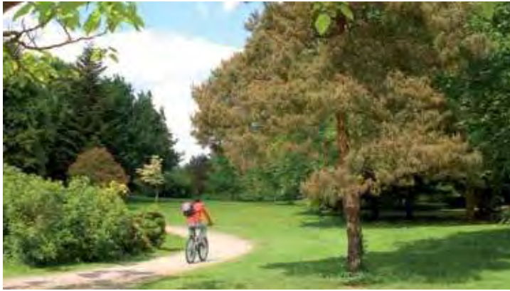
Le Parc des Gayeulles

En remontant l'avenue George Patton en direction du Conseil Régional de Bretagne, la ville de Rennes prend un caractère résidentiel. Le centre-ville est vite oublié pour qui cherche le calme et la tranquillité de ruelles bordées de maisons particulières et de leurs jardins. Les arbres et les fleurs dominent le paysage et les rues se prolongent parfois en chemins de promenade.