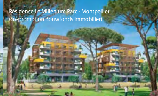
Résidence Le Millénium Parc - Montpellier (co-promotion Bouwfonds immobilier)