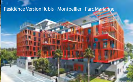
Résidence Version Rubis - Montpellier - Parc Marianne