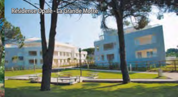
Résidence Opale - La Grande Motte