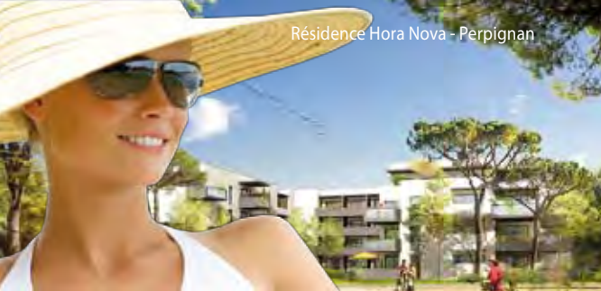
Résidence Hora Nova - Perpignan