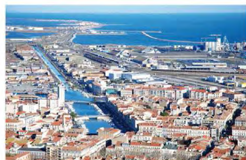
Des airs de "Petite Venise"