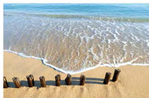
Une plage de Sète...