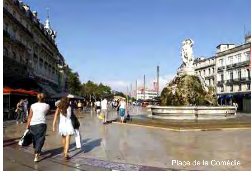
Place de la Comédie