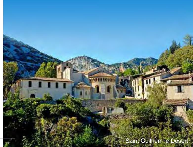
Saint Guilhem le Désert