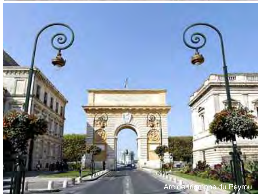
Arc de triomphe du Peyrou