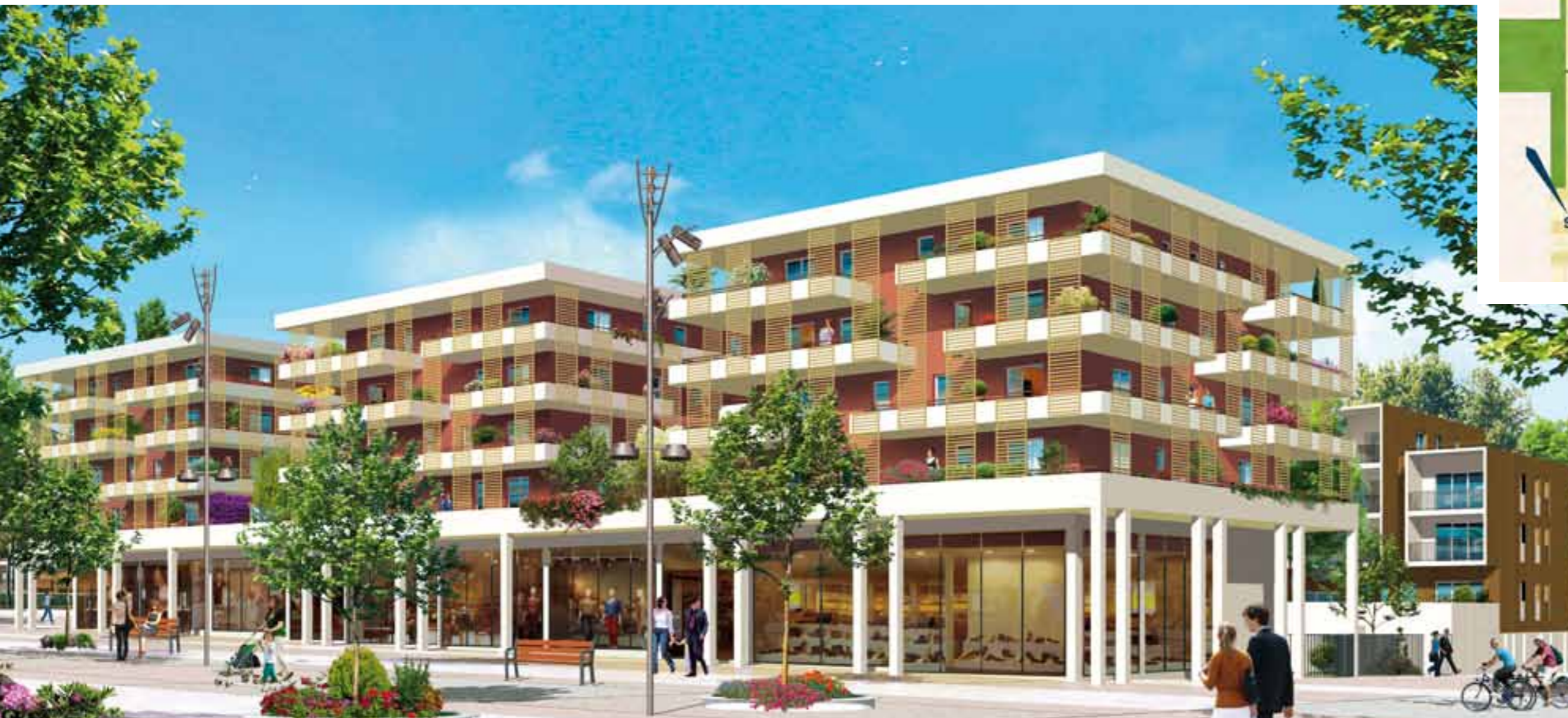
IMMEUBLES VEGA, ATRIA ET MIRA - VUE DE LA PLACE PUBLIQUE