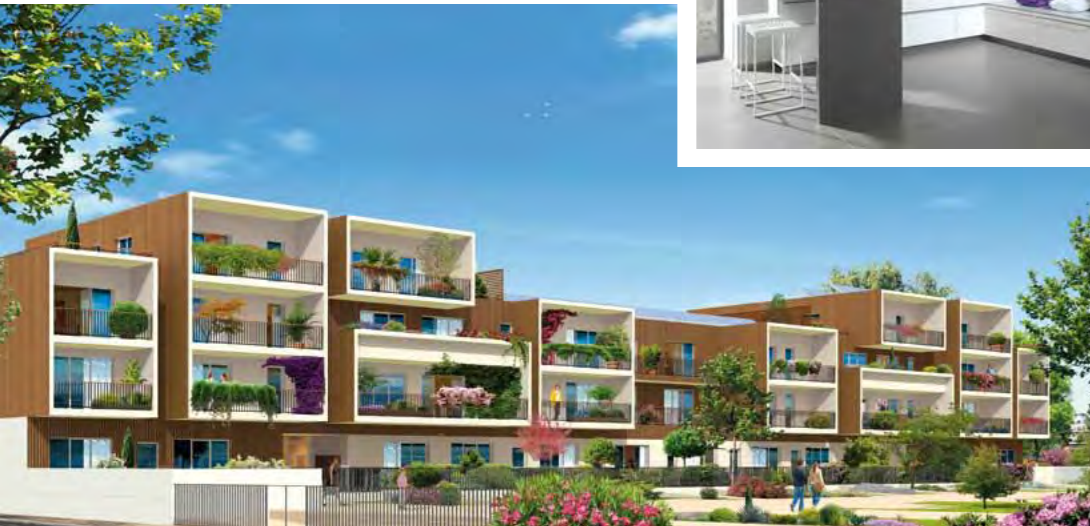
IMMEUBLES KHARA ET CAPELLA - VUE DES JARDINS INTÉRIEURS