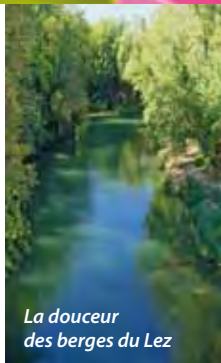
La douceur des berges du Lez

Castelnaud-Le-lez, c'est l'authenticité d'une ville à taille humaine au cœur d'une agglomération qui pousse vers l'est, autour des poumons économiques.