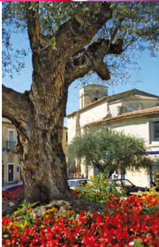
Le cœur authentique

Avec son esprit village soigneusement préservé, la ville cultive les fruits de la réussite. Un environnement très arboré, des infrastructures sportives et culturelles de grande qualité, contribuent à faire de cette ville, une destination très recherchée dans le grand Montpellier. Castelnaud, peut également s'en orgueillir d'abriter de nombreuses entreprises dans ses parcs d'activités en pleine expansion. Investir ou habiter à Castelnaud-le-Lez, c'est faire le choix de l'avenir.