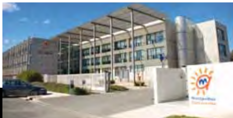
La pépinière d'entreprises Cap Omega aux portes de la ville