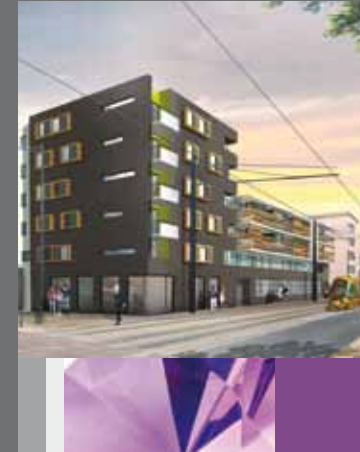
Résidence Neocity - Montpellier - Antigone