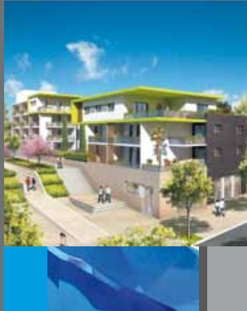
Résidence Olympe - Montpellier Ovalie