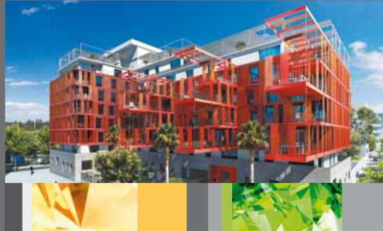
Résidence Version Rubis - Montpellier - Parc Marianne